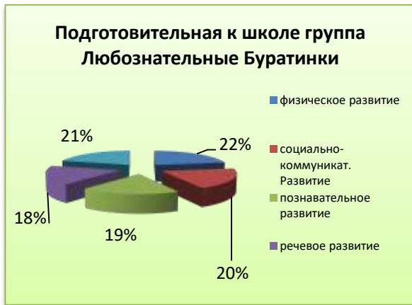
Диаграмма «Мониторинг Образовательного процесса»