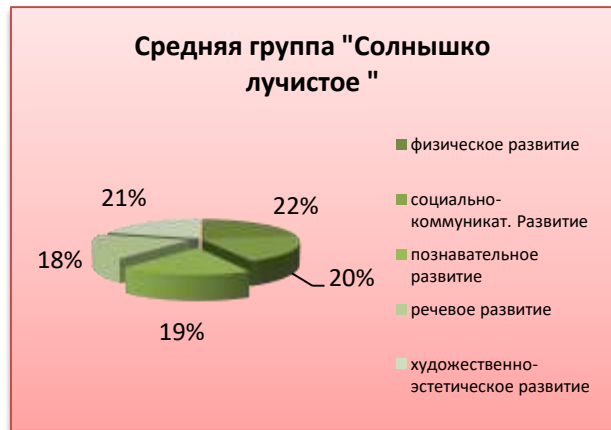
Диаграмма «Мониторинг Процесса детского развития»